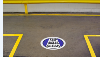
Besseres Band ToughStripe (B-514)

Dieses haltbare, flexible Bodenmarkierungs-Band ist für eine temporäre Anwendung im Innenbereich mit normalem Fußgängerverkehr konzipiert, so daß Sie dieses Band nicht oft erneut anbringen müssen.