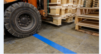
Bestes Band ToughStripe Max (B-543)

Dieses äusserst anpassbare Band ist für eine längerfristige Anwendungsperiode konzipiert und ist ideal für Bereiche mit hohem Fußgängerverkehr geeignet, sowie für leichten Industrieverkehr auf verschiedenen Oberflächentypen.