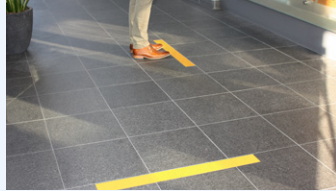
Gutes Band GuideStripe (B-3)

Mit einer geringeren Klebekraft und Haltbarkeit ist dieses Economy-Band für eine kurzfristige Anwendung empfohlen und in verschiedenen Farben erhältlich.