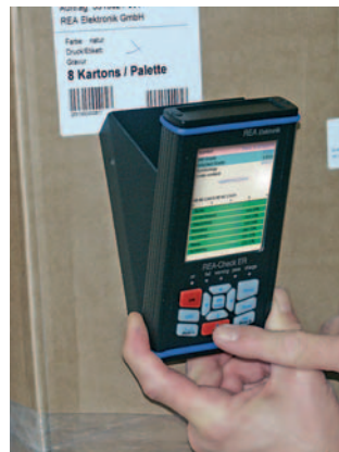
Flexible Barcode-Prüfung vor Ort