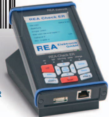
REA Check ER