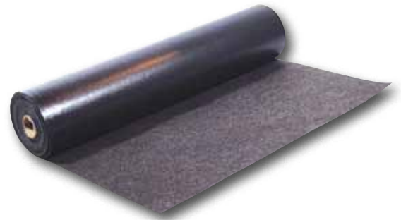
BSM hält Böden trocken und absolut sauber