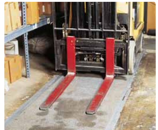
So robust, dass selbst Gabelstapler darüber fahren können