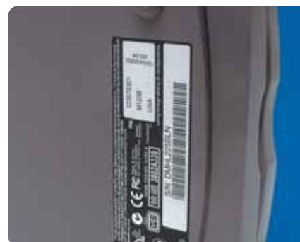
Das Material B-8423 eignet sich für zahlreiche Anwendungen, z.B. Typenschilder für elektronische Geräte.